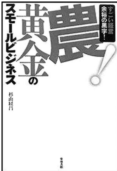
『農！黄金のSMALLビジネス』