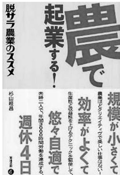
『農で起業する！脱サラ農業のススメ』